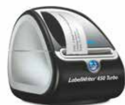
DYMO LabelWriter™ 450 Turbo