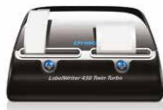
DYMO LabelWriter™ 450 Twin Turbo